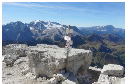
v Dolomitih, čas vzpona 4 ure)

Piz Boe, tritisočak s planinsko postojanko prav na vrhu resda ni Matterhorn, a za nekoga je ta višina mejnik in dobrodošli, da ga dosežete.